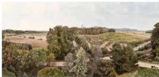
Uitkijktoren no. 1, Noordwaarts, Halckenbroeken en Amerdiep, square/penkekening, 21 x 44 CM - 2020

De keuze voor de inrichting en natuurlijke ontwikkeling wordt niet alleen geleid door natuurlijke factoren, maar heeft ook een maatschappelijke component. Kiest men voor moerassen op plaatsen waar boomseinen staan, dan zullen de bomen in veel gevallen dood gaan. Het oude peromaantriseerde cultuurlandschap maakt plaats voor ruitje, voor 'vland' zouden boeren zeggen. Veel recreanten ervaren moerassen als onaantrekkelijk en ontoegankelijk. Maar zij vormen de basis van de natuur in de beekdalen.