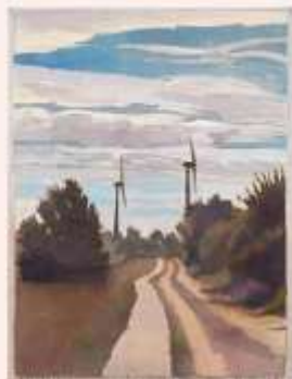
Bargerveen, Oostleinde Landen, aquarel/ gouache, 20 x 15 cm - 2018

De hittegolf duurt voort in de binnenlanden van Nederland. Weer een warme dag. De passaatwind uit het oosten brengt nauwelijks verkoeling. Veel beregening op de landerijen onderweg. Gees lelievelden gezien. Wel klavervelden, een perceel pompoenen en grote percelen boxushagen of een andere heggemvariant.