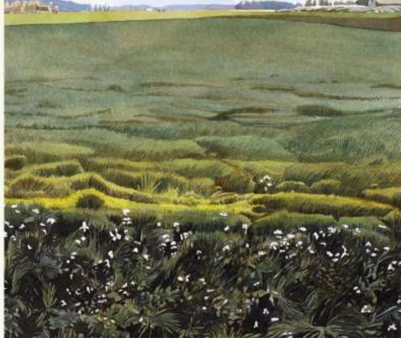
Odoornerveld. De laatste pinksterbloemen staan in de slootwal, oeverwal/gouche. 23 x 26,5 (10 - 2019)

Het gebruik van glyfosaat in de landbouw is alleen maar toegenomen de laatste jaren. Voorheen scheurde een boer nog wel eens machinaal de grascode en spitte die onder, maar dat zie je eigenlijk nergens meer. Het is veel gemakkelijker de boel dood te spuiten om vervolgens jouw genetisch gemanipuleerde zaden in te zaaien. De fabrikant levert het gif en de zaden, wat wil je nog meer! De gangbare landbouw is ondertussen verstaafd geraakt aan het dubsure gif. Dat er nadelen kleven aan glyfosaat is al in vele onafhankelijke onderzoeken aangetoond, maar de landbouwsector gebruikt liever onderzochten die de fabrikant zelf heeft laten uitvoeren en waarin de gevolgen voor mens en milieu worden gebagatelliseerd. Nederland is bovendien een grootgebruiker van glyfosaat bevattend landbouwgif. Een goed heestuurder zou bij een product waarover zo veel twijfel bestaat uit voorzorg een verbod alvaardigen.