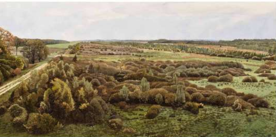
Oelmers. Zuidwaarts vanaf dit punt (vanaf de uitkijktoren), Kranenveen, Westerbroeken, square/voonche/zwemtoestel, 20 x 42 CM - 2020

heringericht door verlaging van de grondwaterstand, afvlakking van het reliëf, ontwatering en drainage van de natste delen, dampen van sloten, verwijderen van houtwallen, samenvoeging van tientallen percelen tot enkele grote lappen, scheuren en onderwerken van de soms eeuwenoude zode, intensieve beweiding, bemesting en maaibeurtten en de omzetting van weiland in akkerbouwgebied. Alles onder het regiem van ruilverkavelingen ten dienste van de moderne, puur op productie en efficiency gerichte agrarische bedrijfsvoering. Afwatering, het op kleinschalige wijze graven van relatief ondiepe sloten ging over in een sterke ontwatering met meer dan twee meter diepe grachten waardoor het gemiddelde grondwaterpeil met minstens twee meter zakte. Behalve deze schokkende herinrichting speelt de vervuiling van lucht, water en bodem een negatieve en overheersende rol in de mogelijkheden om natuurlijke processen in de beekdalen te herstellen.