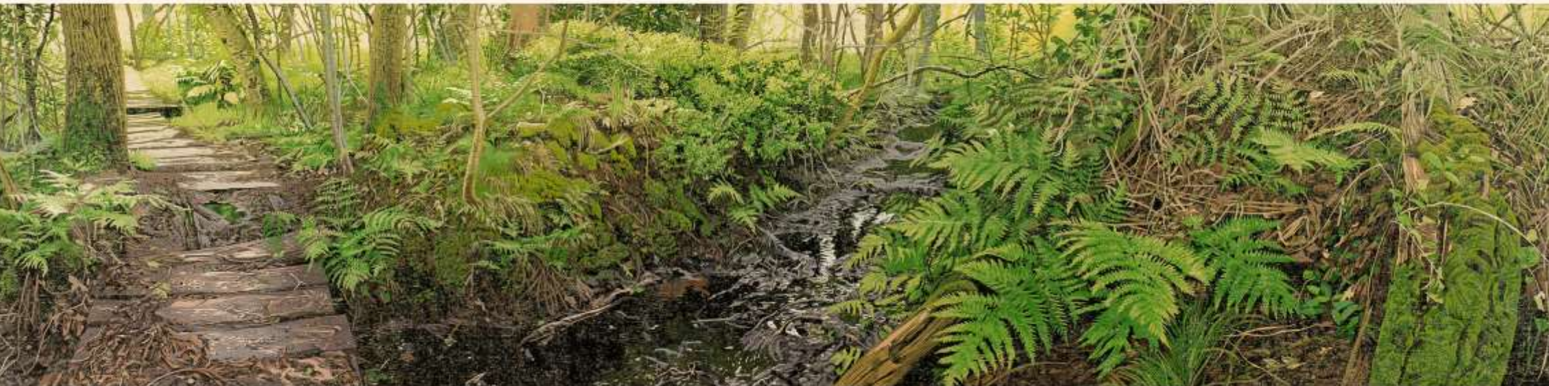
Het Ikenbos no. 3, 1999-2018, nabij Oudemolen, oude situatie, kleurenhoutsnede, 25 x 98,6 cm - 2018

schap op de smalle uitlopers van de hoondsug. De weg komt uit op de rijksweg naar Grostegen.