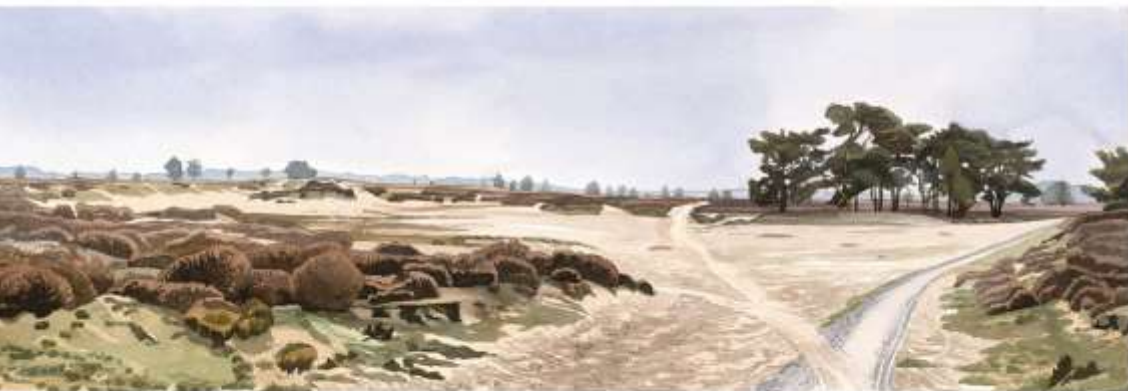
Balleoërveld, oquarel/gouache, 84 x 262 cm - 2020

flink deel van de Drentse heide een vochtig karakter, samenhangend met de keilom in de ondergrond. Het Dwingelderveld is vooral daarom beroemd in West-Europa. Rond het hoogtepunt van de heide-landbouw, omstreeks 1800, was driekwart van de provincie bedekt met heide en veen. Door intensief gebruik ontstond al in de bronstijd een vorm van rooibouw waardoor zandverstuivingen ontstonden. Enkele van die zandbakken zijn tot in onze tijd blijven bestaan. Zowel op het Balleoërveld als in de Gasterense duinen en overal waar de veldnamen 'zand' en '-duinen' voorkomen, zijn restanten van recentere zandverstuivingen aanwezig.