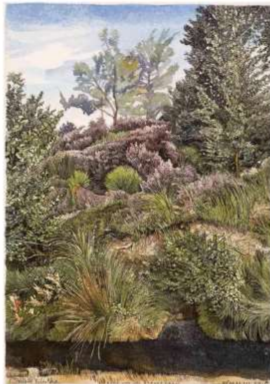
Rand van het Bargerveen, 30 graden op 30 juli 2018, aquarel/peensakenhg, 31 x 22 cm - 2018

In de negentiende eeuw leidden de Weiteveense veenboeren net als de veenarbeiders een sober bestaan. Zij verbouwden boekweit op het hoogveen en hielden daarnaast kleinvee, waaronder veel schapen. De tien vermelde schapenskoolen op de topografische kaart van 1902 (Historische Atlas Drenthe, kaartblad 160, Amsterdamsche Veld) onderstrepen het belang van de schapenstalt voor het levensonderhoud. Begin twintigste eeuw was de bevolking van Nieuw-Schoone-